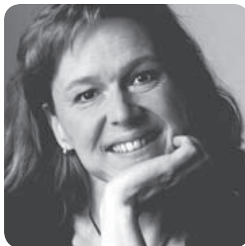
Zu wem verschwindet Antje, wenn ihr Mann alleine in der Sauna schwitzt?

gelische Kindergärten, Diakoniestationen oder Friedhöfe. Dafür trägt dann der Kirchenvorstand die Verantwortung. Die Pastorinnen und Pastoren