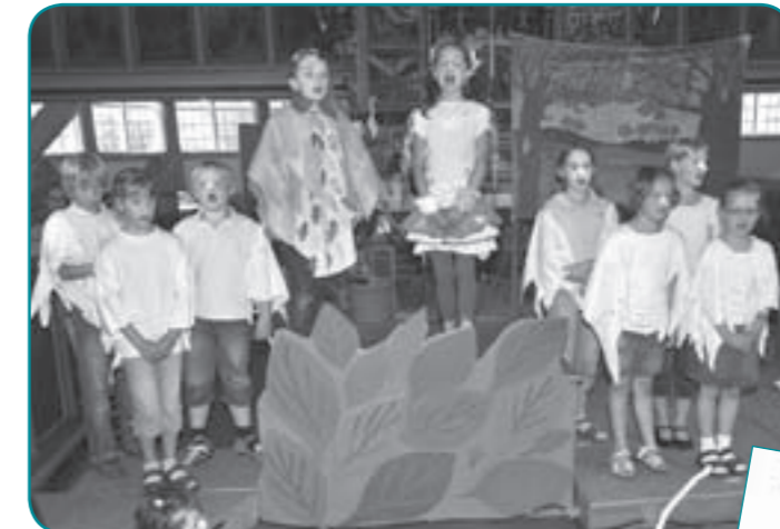
Da muss man brüten, brüten, brüten ...

Passend dazu war die Kirche mit allerlei Urlaubsspuren geschmückt worden, so dass sich die Gottesdienstbesucher über einen Sonnenschirm über