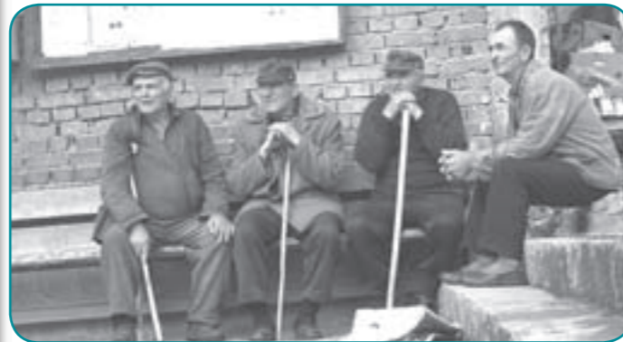
Bulgarische Männer studieren die Touristen aus Allermöhe-Reitbrook

Die Reisegruppe der Dreieinigkeitskirche feiert am Sonntag, dem 26. Oktober 2008, ihr dreißigjähriges Jubiläum. Es begann mit einer Idee 1977 auf einem Kegelausflug nach Königswinter: warum sollen wir es neben Kinder- und Seniorenfahrten nicht einmal mit Kurz-Reisen für junge Erwachsene in europäische Hauptstädte versuchen?