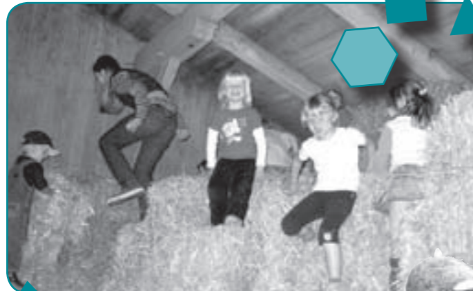
Kommt einfach vorbei! – Wir freuen uns – Die Krümelmonster

Besonders wichtig ist uns eine Erziehung zur Selbständigkeit und zur Entfaltung der Persönlichkeit.